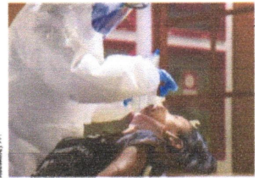
FUTURO Caso da pandemia nas Américas permanece muito incerto