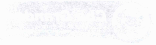
TABELA DE CARGOS